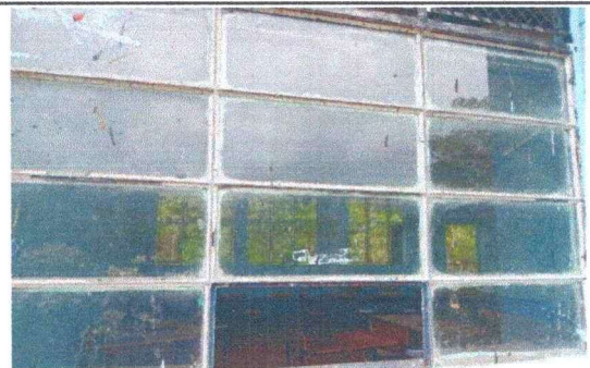
Foto 6: Se observa la necesidad de colocar vidrios en ventanas. M.1

Observación: Si es necesario se pueden agregar hojas adicionales y actualizar el número de hojas.