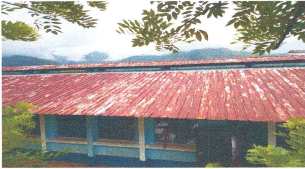
Foto1: Se observa el deterioro de la cubierta de lamina. M.1