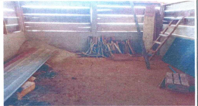
Foto 2: Se observa la necesidad de colocar piso de cemento normal en la cocina. M 2