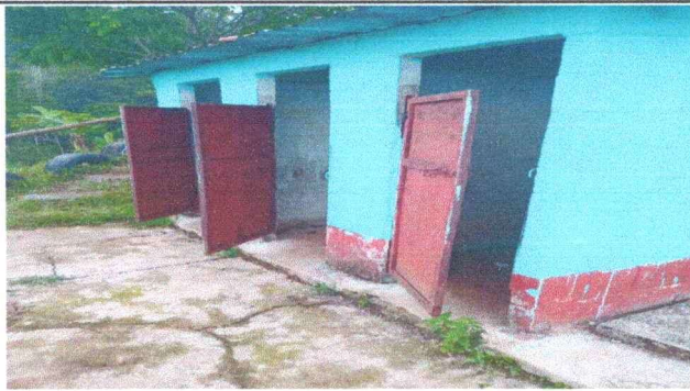
Foto 3: Se observa la necesidad de sustituir las puertas de baños y las cubiertas de láminas. M.3