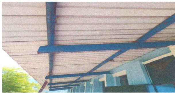
Foto 5: Se observa la necesidad de darle mantenimiento a la estructura de techo. M.1